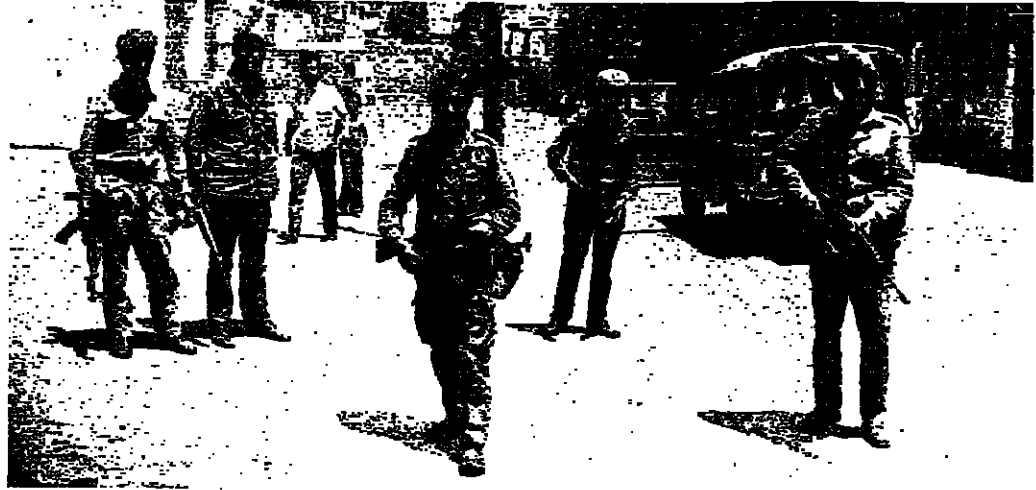
دورية مشتركة من رجال الشرطة والكشاح المسلح

استمر تبادل إطلاق النار أمس في بيروت بصورة متقطعة، والتقت مجموعة جديدة من المتفجرات، كما أطلق رصاص كثيف بعد استقالة الحكومة، في العاصمة والضواحي وبعض المناطق، في وقت وأصلت فيه اللجان المشتركة مهماتها. وحصلت العصابات الأخيرة كانت عشرة قتلى وعددا من الجرحى بين المارة، وبين المصلين الذين يمتدحون حبيب، وقد نقل إلى مستشفى القاصد، وحالته غير خطيرة. وتواصل اللجان المشتركة وقوى الأمن، تنفيذ القصاص من سطح إلى سطح، كما نزل على مسرع وقت الاشتباكات، تهبدا لمودة اليهود.